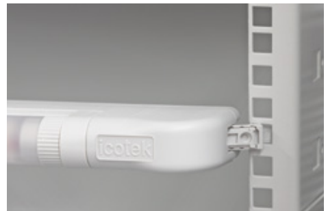
Einrasten im 19" Rack