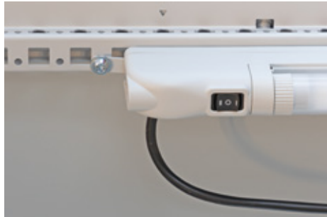
Assembly with screws on profiles and surfaces