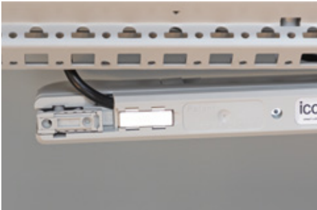
Assembly with integrated magnets