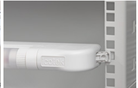
Snap-in assembly in the 19" rack