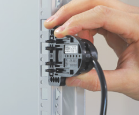
Einrasten (Montagehilfe) und Schrauben auf Profilen