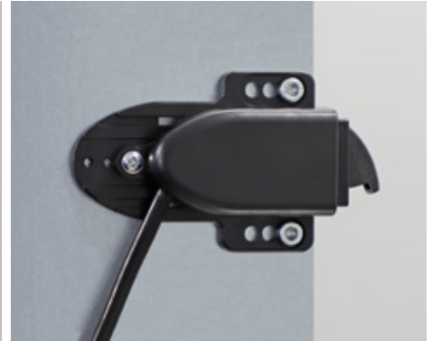
Schrauben auf Flächen